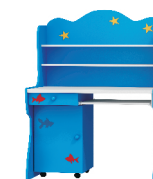
150x100x60 biurko z nadstawką blat na wys. 75