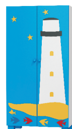
180x90x52 szafa 2 drzwiowa