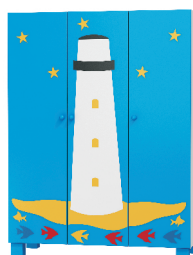
180x135x52 szafa 3 drzwiowa