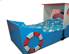
62/110x96x188 łóżko STATEK przód na wys. 62