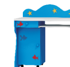
97x101x60 biurko bez nadstawki blat na wys. 75