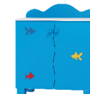
108x91x54 szafka 2 drzwiowa