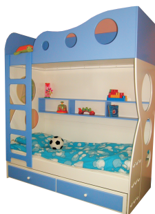
209x95x184 łóżko FALA