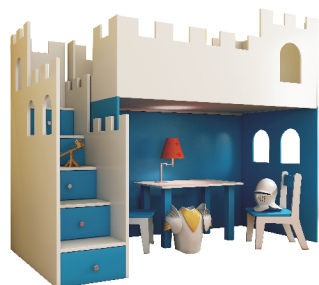
160x45x130 komoda SCHODKI