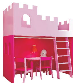
185/160x95x184 łóżko antresola ZAMEK w opcji z komodą w kształcie schodów