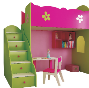
135x54x135 komoda SCHODKI