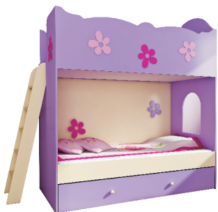
202/185x96x184 + drabinka 100 łóżko piętrowe CLASIC z drabinką

Łóżka wykonane z płyty MDF, malowanej farbami wodnymi akrylowymi.