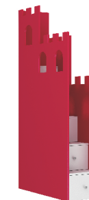
195x45x130 łóżko piętrowe ZAMEK opcjonalnie z komodą SCHODKI