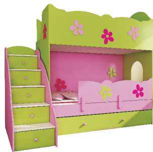
202/185x96x184 łóżko piętrowe CLASIC opcjonalnie z komodą SCHODKI