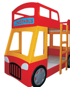
178/158x99x210 łóżko LONDON BUS